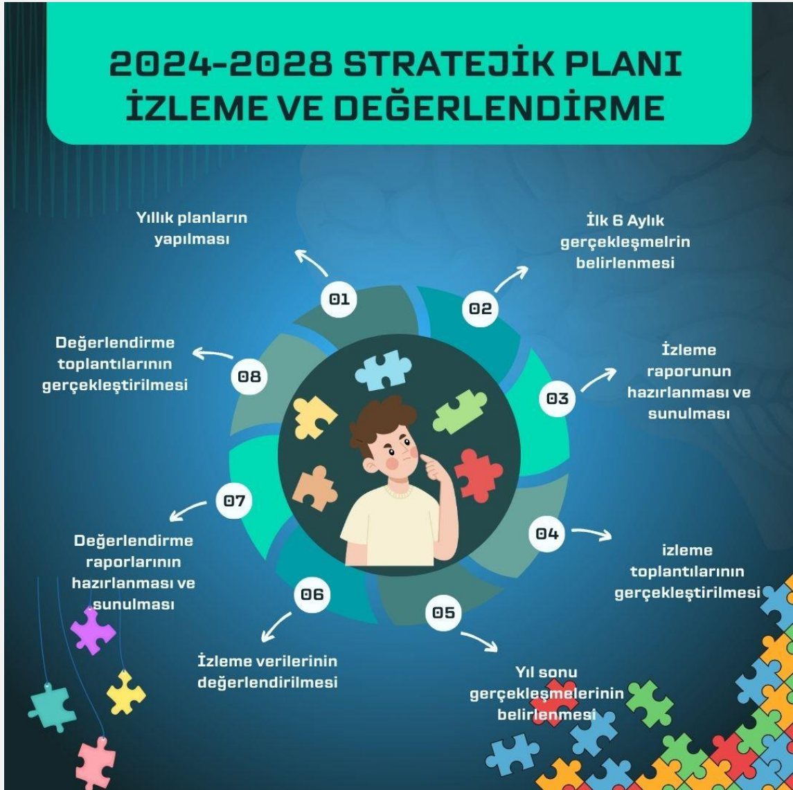
Şema 3: izleme / Değerlendirme Süreci

Okulumuz Stratejik Planı izleme ve değerlendirme çalışmalarında 5 yıllık Stratejik Planın izlenmesi ve 1 yıllık gelişim planının izlenmesi olarak ikili bir ayrıma gidilecektir. Stratejik planın izlenmesinde 6 aylık dönemlerde izleme yapılacak denetim birimleri, il ve ilçe millî eğitim müdürlüğü ve Bakanlık denetim ve kontrollerine hazır halde tutulacaktır. Yıllık planın uygulanmasında yürütme ekipleri ve eylem sorumlularıyla 6 aylık ilerleme toplantıları yapılacaktır. Toplantıda bir önceki 6 ayda yapılanlar ve bir sonraki 6 ayda yapılacaklar görüşülüp karara bağlanacaktır.